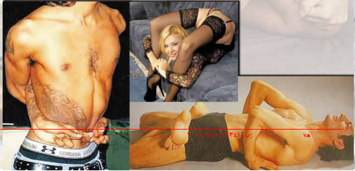
ژمارە (۶۳۴) ۲۰۰۷/۵/۱۴