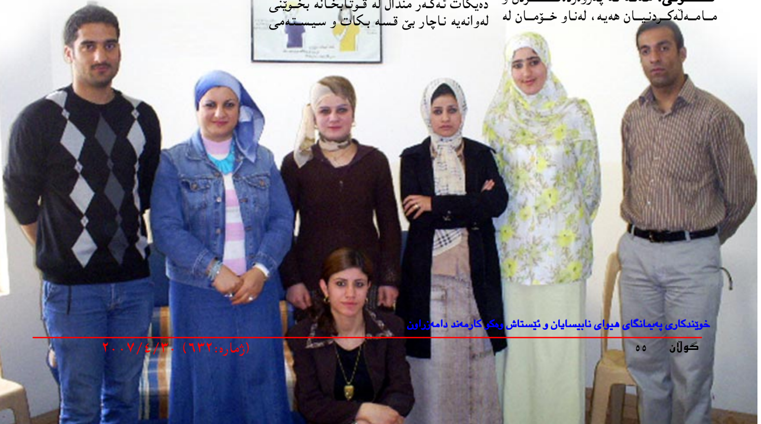
خویندکاری پهیمانگای هیوای ناپیسایان و ئیستاش وهکو کارمه ند دامه زراون