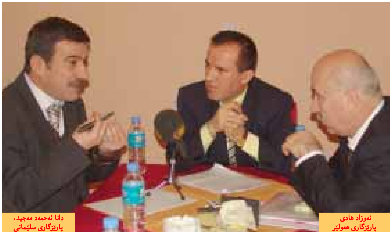
دانا ئەحمەد مەجیدی، پارێزگاری سلێمانی