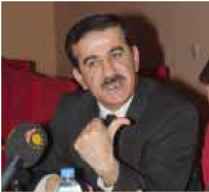
نندازيار عبدالللا، ياريدهدري سهروكي شارهواني سلیماني

۱۵۹ هاتووه له سالی ۱۹۶۹ که زور به ریکوپیتیکی نهو یاسایی پاریزگاګانه بهلام کاری پینهکرا.